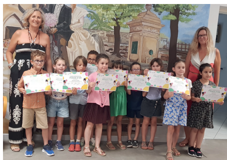
Les participants du coup de pouce