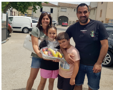
Les gagnants de la chasse au trésor